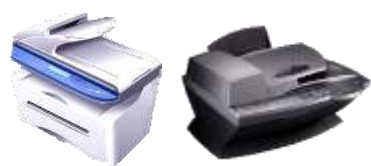
多機能プリンター (MFP)