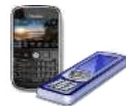
スマートフォン 携帯電話